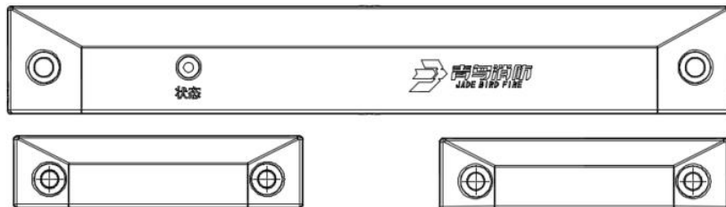
图 1 JBF62D-33P 安装示意图