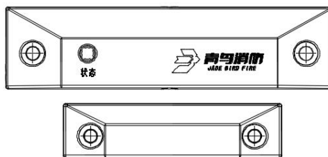
图 2 JBF62D-32P 安装示意图